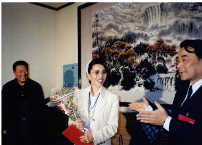
航天部長，孫家棟教授