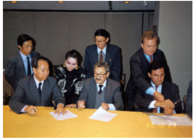
上官士盤將軍—國防科學技術工業委員會委員