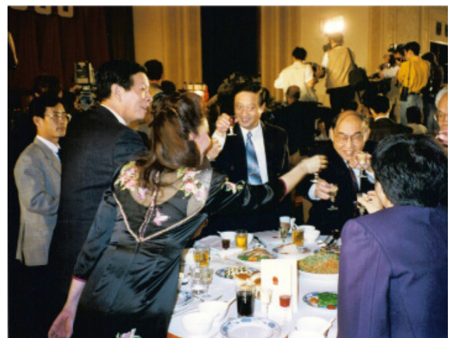
廖暉先生（圖左）——前國務院港澳事務辦公室主任、黨組書記