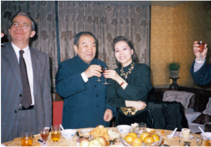
布赫—內蒙古自治區主席；成吉思汗第23代後人