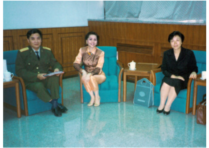
沈榮駿將軍（圖左）——前國防科工委主任